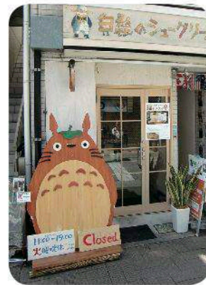
▲ 白髭のシュークリーム工房