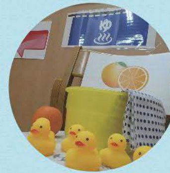
替り風呂と春の遠足 日介ケアセンター西新井