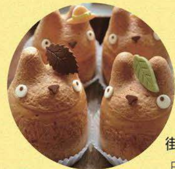
街紹介 日介センター吉祥寺