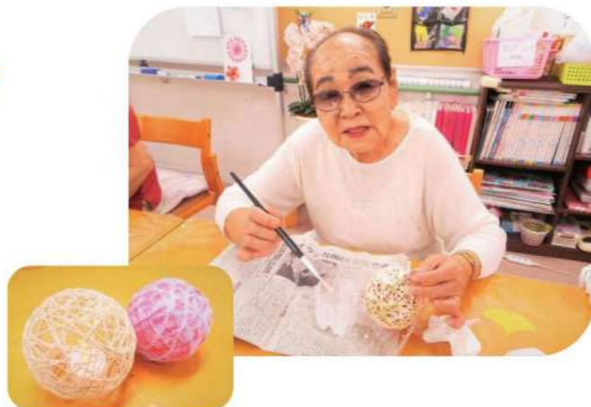
↑ランプシェード作り。風船に毛糸を巻いて水で溶かしたボンドを塗っています。

中でも大好評だったのはランプシェード作りです。少ない材料で手軽に作れ、見た目もおしゃれということで、作ってみたいという声が多く、「他の色でも作りたい!」と2~3個作られる方もいました。就寝時に使用する方や、ご家族にプレゼントされる方もいらっしゃいました。