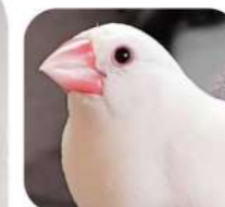
←R.Nさんと 「ケンゾー」ちゃん