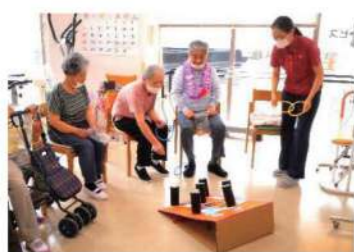
←輪投げの レクリエーション

日介ケアセンター西新井は午前と午後の半日のデイサービスで、初めてデイを利用する方や、午前もしくは午後は自由に過ごしたいという方に多くご利用いただいています。入浴のサービスも行っており、隔週で実施する「変わり風呂」はともにご好評いただいています。体操は「憧れのハワイ航路」等の馴染みのある曲を使ったリズム体操や、職員考案のボールや手拭いなどを使用した6種類以上のオリジナル体操にも力をいれています。その他、機能向上の為の製作や、ゲームレクリエーションも限られた時間の中で行っています。