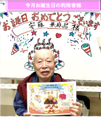
今月お誕生日の利用者様