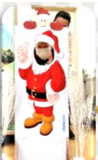
光が丘ローズガーデン