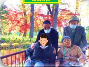
ホビーセンターカー