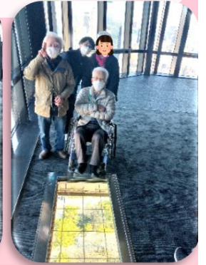
外出イベント(東京タワー)