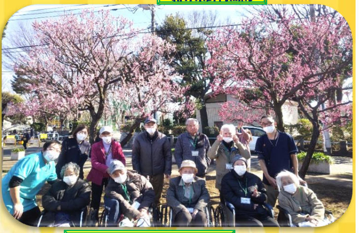
中野歴史民俗資料館