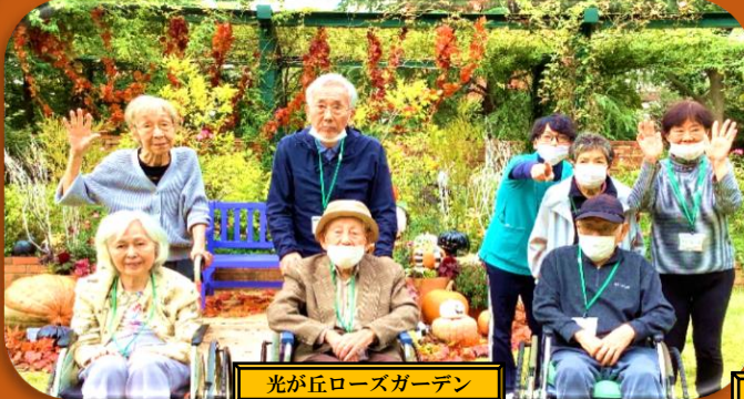
光が丘ローズガーデン