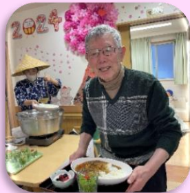
皆様大好き手作りカレーでバレンタイン