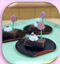
生クリーム乗せの 水羊羹も手作りです